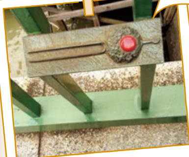
柳橋の船乗り場。 柳橋と言えは粋な芸者さん。 橋の欄干もかんざし。

江戸時代の人々が生活した色々な出来事を詰め ちよきぶね 猪牙船に乗って川を上ったり、下ったり、渡ったりした橋等を想像（妄想）しながら休日を満喫しました。下船場に近づくと、急に現実に戻りました。花柳界として栄えた柳橋（柳橋芸者で知られる花街）で下船し安政元年創業の「柳橋亀清楼」（伊藤博文氏も通っていた料亭）で昼食。江戸の味と季節の味を活かした佃煮が人気の「柳橋小松屋」で佃煮のお土産を買いまくり、浅草橋をのんびりと散策、お天気にも恵まれ古地図片手に廻った江戸探訪、学びにもなったし、癒しにもなった、心が軽くなった休日でした。