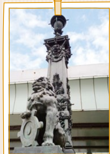
銀座三越 船乗り場

三越前駅で集合、江戸の歴史を頭に描き時代小説に出てくる「橋」や「川」を探訪しました。鎌倉河岸捕物控に出てくる日本橋、鎌倉橋、 まなしたばし 俎板橋、昌平橋、浅草橋、柳橋は有名です。ガイドさんの話で、「鎌倉橋左岸下流側には、江戸城建設の際に鎌倉から運んだ木材や石材を荷揚げした河岸があり、鎌倉河岸と呼ばれていたそうです。護岸の石組には各藩の刻印が石に刻まれており、そこからその藩の財政の状態が分かるようになっていたそうです。神田川は江戸城外堀としての機能を果たしたほか、江戸市中へと水を運ぶ神田上水としても利用されていた重要な水路でもありました。」とのこと。